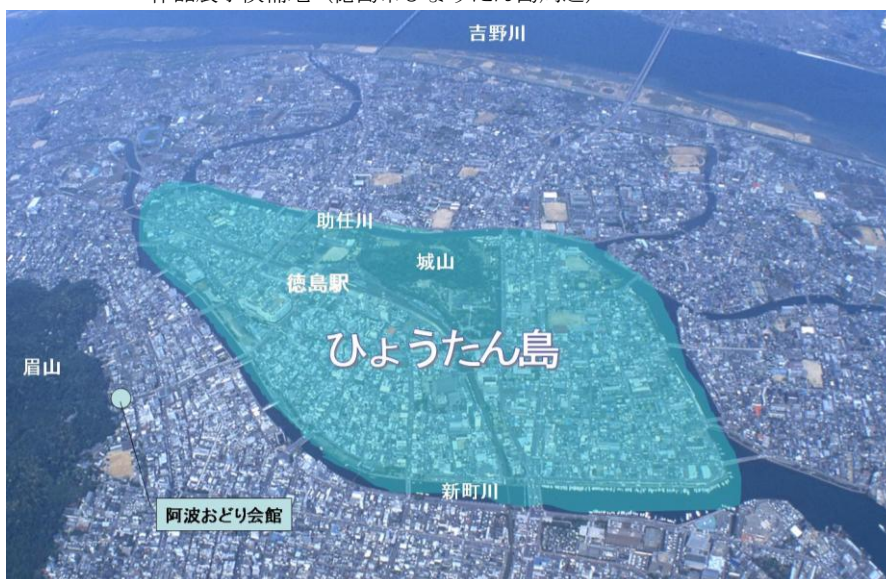
作品展示候補地 (徳島市ひょうたん島周辺)